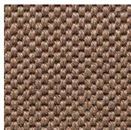
Sisal Panama | 9005