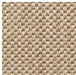
Sisal Panama | 9002