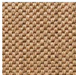
Sisal Panama | 9001

De Panama combineert duurzaamheid en natuurlijke aantrekkingskracht met een opvallend zacht en luxe gevoel. Dankzij de innovatieve constructie biedt deze kwaliteit een harmonieuze blend van comfort en duurzaamheid. Beschikbaar in diverse elegante kleuren en texturen om ieder project te verfraaien zonder concessies te doen aan comfort.