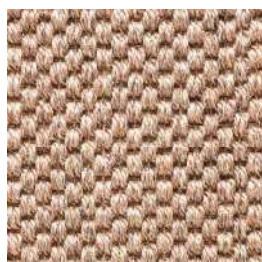
Sisal Panama | 9006