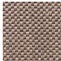
Sisal Panama | 9004